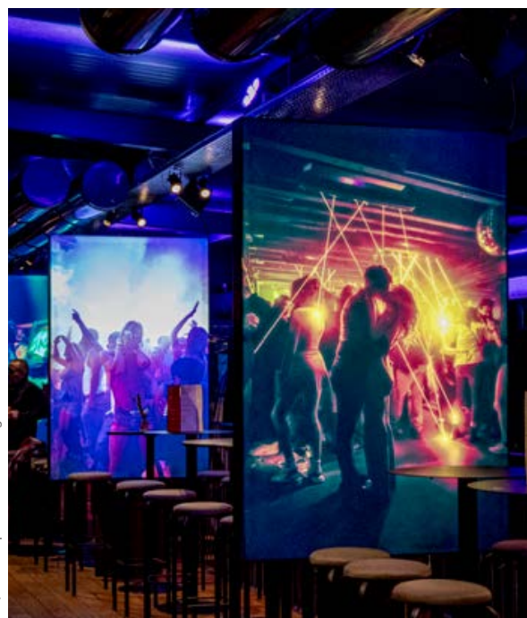
© Quai de la photo ©Charlie Egraz