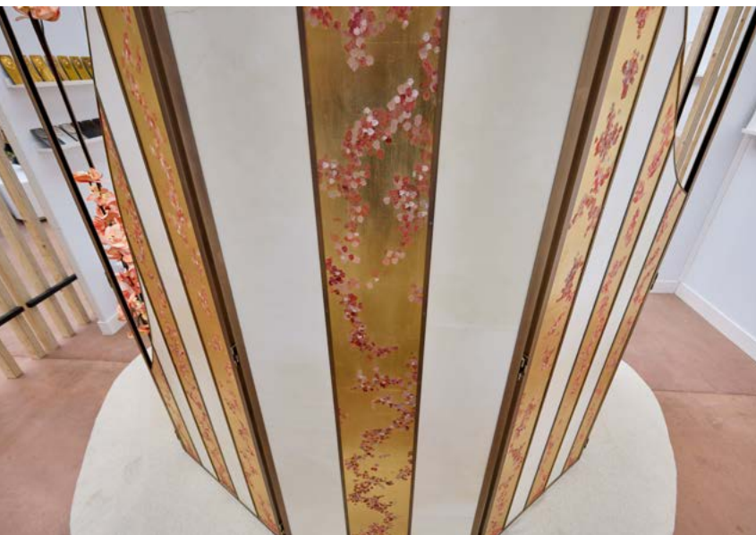
© Theodose Sophie_Maison Rennotte _Paravent Blooming Pompadour - The art of making