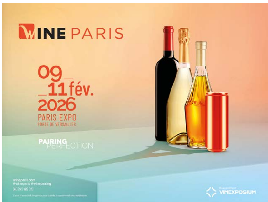
Salon Wine Paris 2026