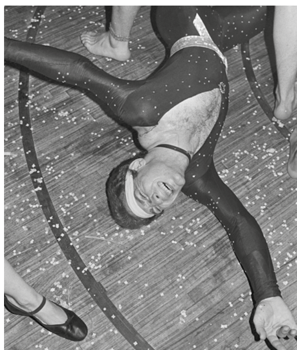
© Dancing ecstasy le clique nyc 1979-3200x0