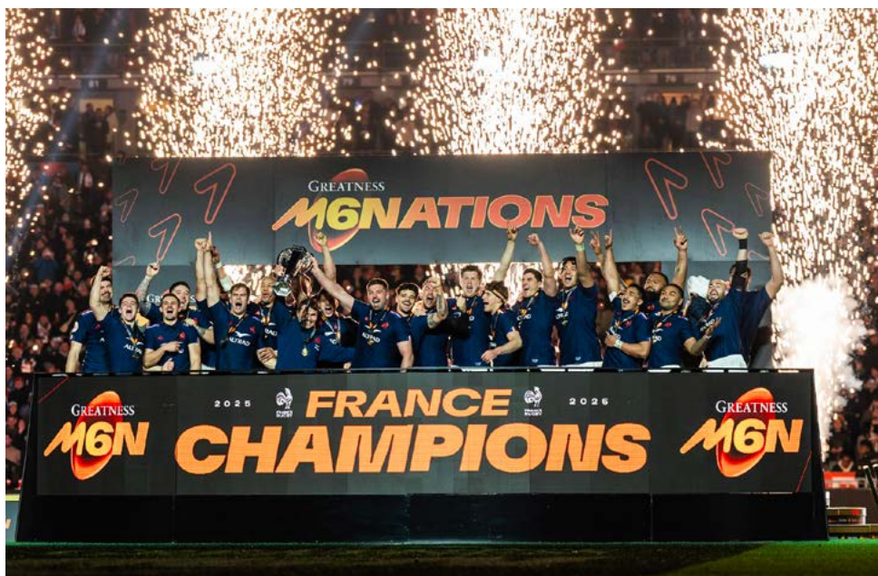
Tournoi des VI Nations