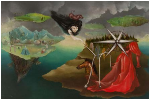
© Leonora Carrington, Artes, 110, 1944, huile sur toile, 40,6 x 60,9 cm, collection privée © Adagp, Paris, 2026 © NSU Art Museum Fort Lauderdale