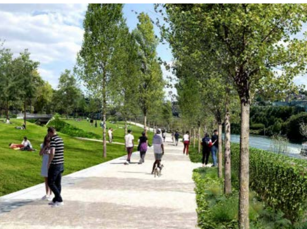
© csm parc G. Mougins bb5157d4ee - Michel Desvignes