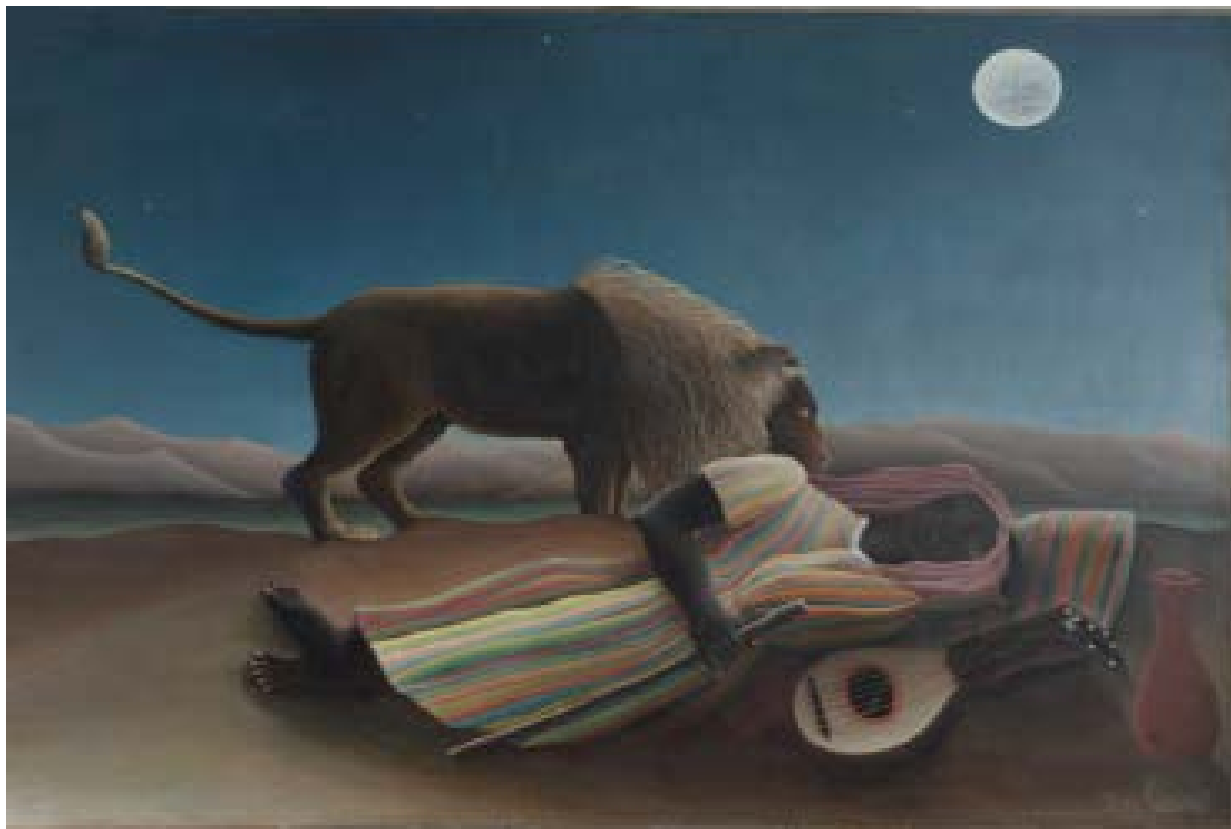
©Henri Rousseau (1844-1910), La Bohémienne endormie, 1897, huile sur toile, New York, The Museum of Modern Art, gift of Mrs. Simon Guggenheim

parisjetaime.com/eng/event/exhibition-lee-miller-paris