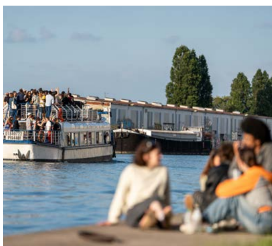
Été du Canal - Navettes fluviales 2.