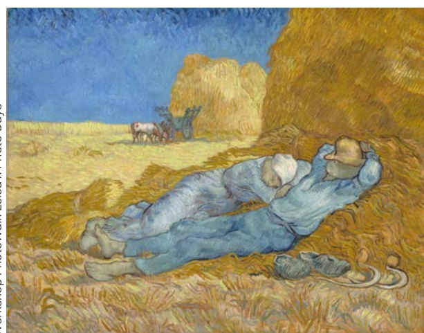
Workshop PhotoWalk Leica x Photo-Days

parisjetaime.com/eng/event/mif-expo-salon