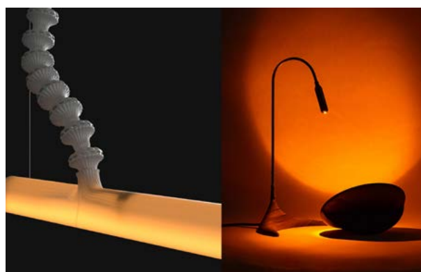
ImgWeb_S25_PDW_News007_ Article_02_2880x1580_Main_EspaceCommunes.

madparis.fr/Look-40-ans-de-mode-au-musee