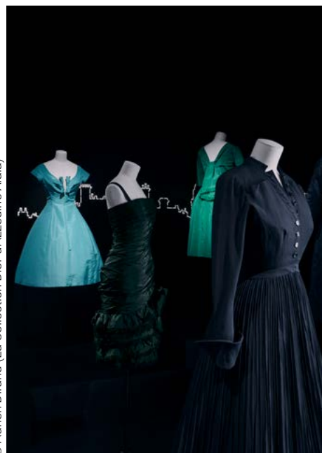
© Adrien Dirand (La Collection Dior d'Azzedine Alaïa)

parisjetaime.com/eng/event/exhibition-dynastic-jewels