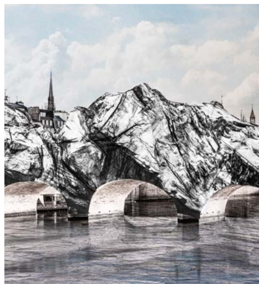
JR, La Caverne du Pont Neuf collage préparatoire, 2025.

jr-art.net/projects/la-caverne-du-pont-neuf