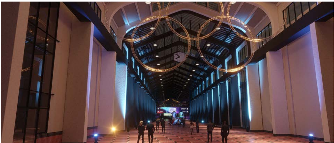
Cité du Cinéma - Saint-Denis