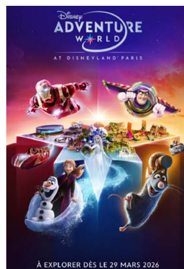
Affiche Disney Adventure World - DisneylandParis

disneylandparis.com/en-gb/destinations/disney