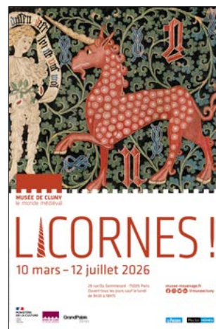
Affiche exposition Licornes - musée de Cluny

From 10 March to 12 July 2026 Musée de Cluny - Musée national du Moyen Âge parisjetaime.com/eng/event/exhibition-licornes-musee-de-cluny-paris