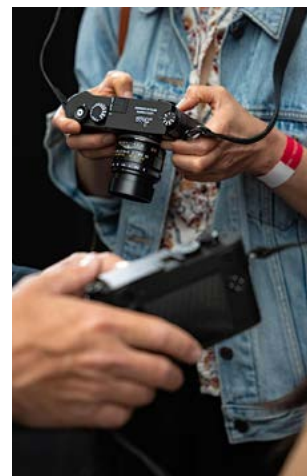
Workshop PhotoWalk Leica x Photo-Days