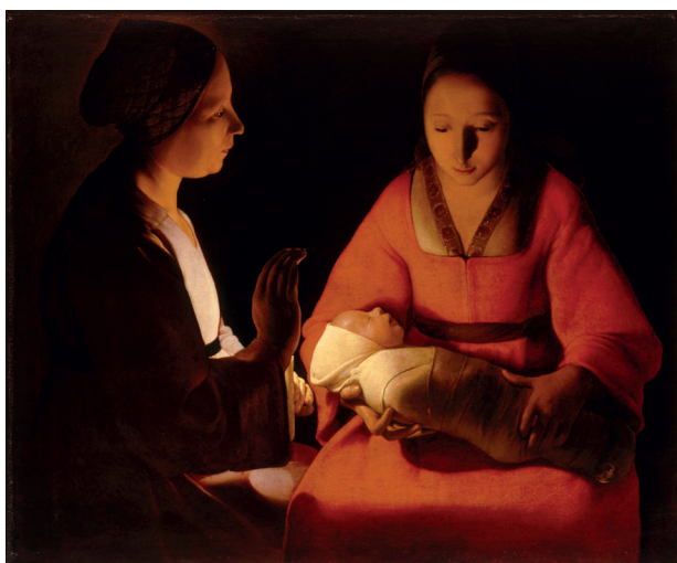
© Georges de la Tour Le Nouveau-Né, vers 1645, huile sur toile, 76,7 x 95,5 cm, Rennes, musée des beaux-arts