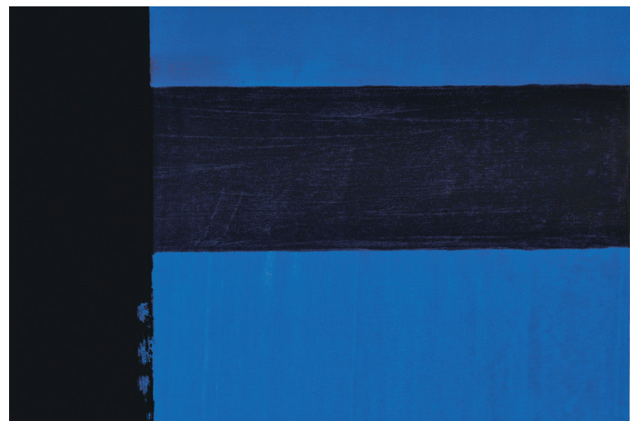
© Œuvre Pierre Soulages, Gouache et encre sur papier marouflé sur toile 99 x 63,4 cm, 1978, Collection C.S.