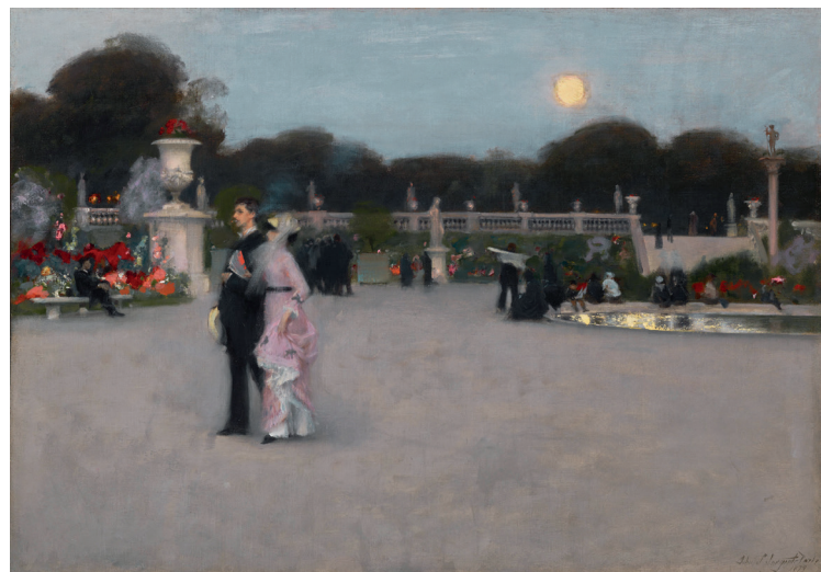
© John Singer Sargent œuvre « Dans le jardin du Luxembourg »