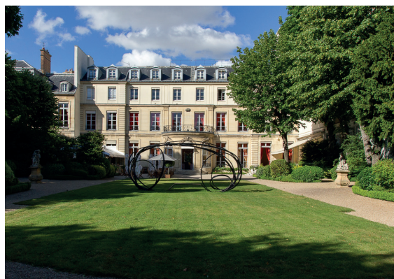
© Maison de l'Amérique latine, jardin. Sculpture Pablo Reinoso