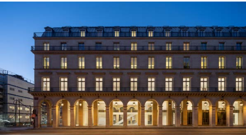
© La Fondation Cartier pour l'art contemporain, 2, place du Palais-Royal, Paris. © Jean Nouvel ADAGP, Paris, 2025. Photo © Martin Argyroglo