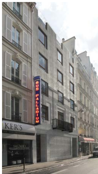
© SKO-HBP - facade sur rue-PC-2017 Bus Palladium.