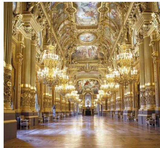
Opéra de Paris - Le Grand Foyer du Palais Garnier © Jean-Pierre Delagarde.