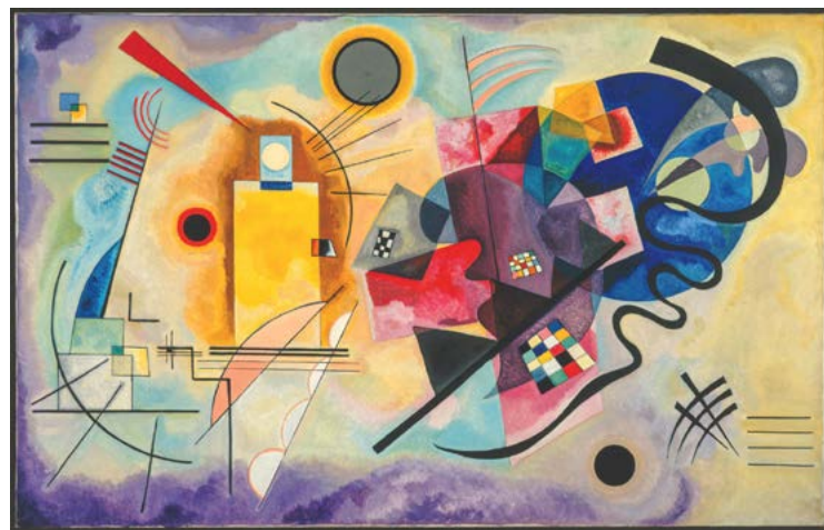
© Kandinsky, The Music of Colours Donation de Mme Nina Kandinsky, 1976.