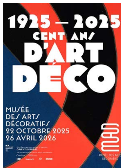
© 1925-2025, cent ans d'art déco.