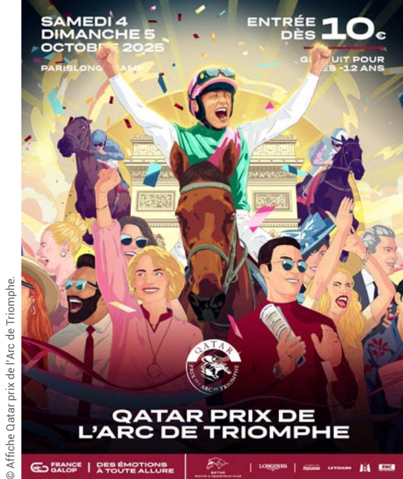
© Affiche Qatar prix de l'Arc de Triomphe.