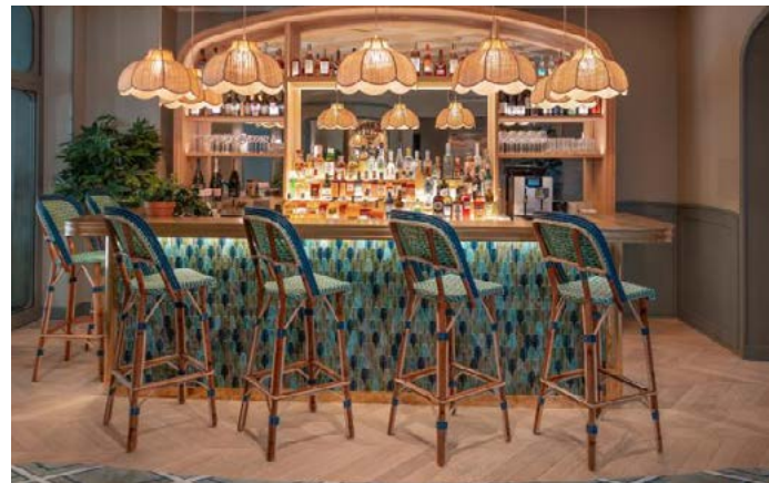
Bar et lobby Art deco - Hôtel Miss Fuller