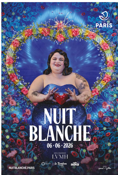
« La dame de cœur » © Pierre et Gilles, 2026 Design graphique : Studio Ville de Paris