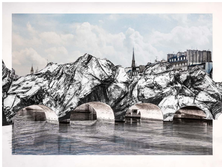
Photo © Courtesy Atelier JR ©2025 JR, La Caverne du Pont Neuf collage préparatoire