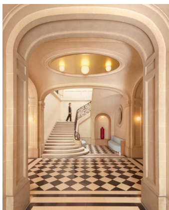
CGS, Maison Guimet, Musée Guimet, 2026_V1170877 © Vincent Leroux, DA Constance Guisset Studio