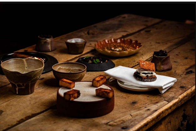
© Double Impact - Amélie Jallot